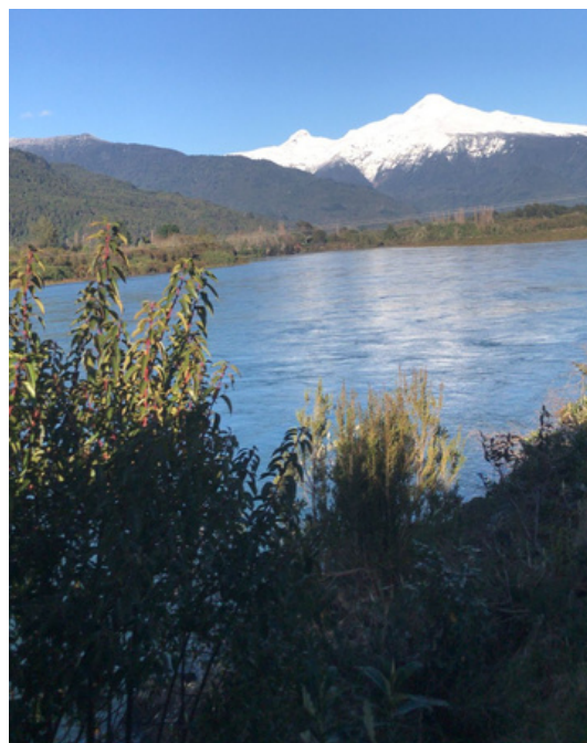
FOTOS: 1 RÍO PUELO, 2 RÍO PUELO CON VOLCÁN YATES DE FONDO. REGIÓN DE LOS LAGOS. INVIERNO DE 2023.