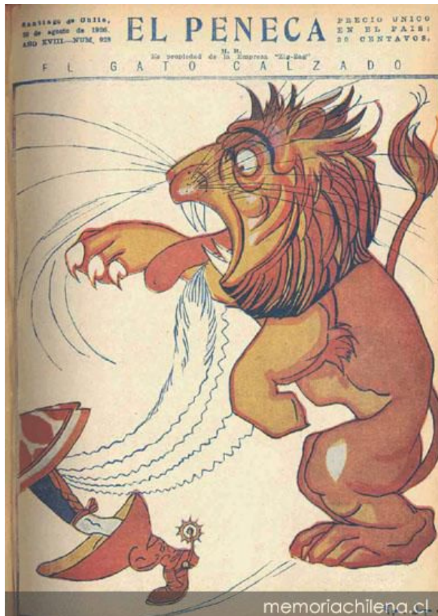
LÁMINA EL PENECA, 1926.