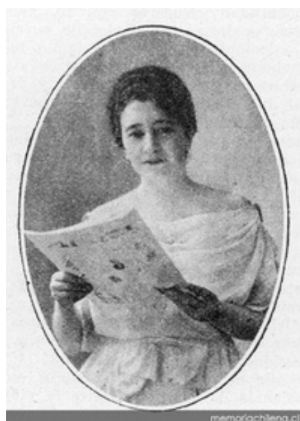
FOTOGRAFÍA DE ÉLVIRA SANTA CRUZ OSSA, AÑO 1920.

Había estudiado sociología en Europa, y estaba convencida de la necesidad de que las mujeres accedieran a la educación en todos sus niveles y al voto. En su época, posturas francamente valientes y rupturistas.